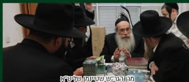
מרן הגר"ש שטיינמן שליט"א