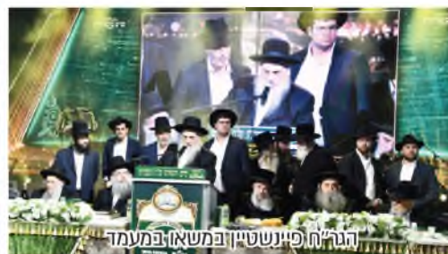
הגר"ח פיינשטיין במשא ובמעמד