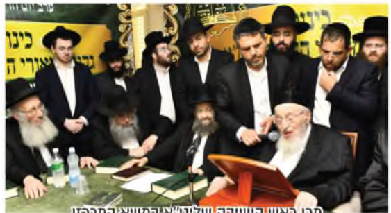
מרן ראש הישיבה שליט"א במשא המרפז