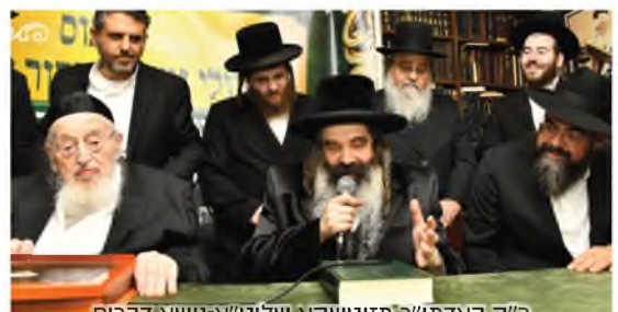
כ"ק האדמו"ר מזוטשקא שליט"א נושא דברים

הכינוס המרום הסתיים, גדולי וצדיקי הדור נטלו ויצאו בברכת השנה זה מזה ובראשם ממרן ראש הישיבה שליט"א, התחושה היא שעוד שלב במסירת התורה ירד לעולם, עם כימונו בשנה השלישית הקובעת חזקה לעצמה - של המפעל ה'דף היומי' משניות שכאמור קיבל משנה חיזוק - תרתי משמע - בהוצאה המהודרת של ממלכת התורה 'עוז והדר' כרך המשניות המבוארות.