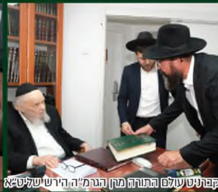
קברניט עולם התורה מרן הגרמ"ה הירש שליט"א