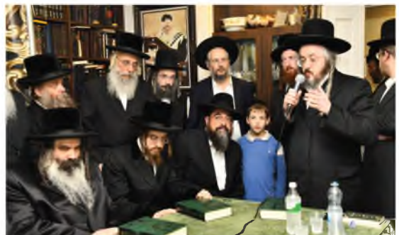
ריש מתיבתא 'עוז והדר' הגרמ"מ כומרניץ שליט"א נושא דברים