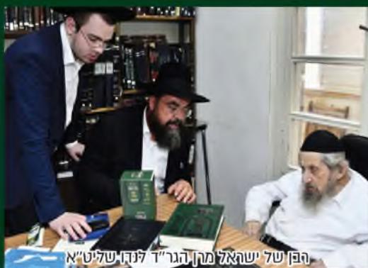
הפנ"ש של ישיבת מרן הגר"ד לנדא שליט"א