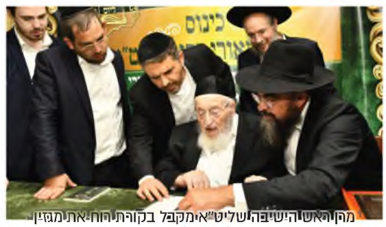
מהר"א ראש ישיבה שליט"א מקבל בקורת רוח אתימגין משנתנו 1 ש"ל בתחילת המחזור אשתקד