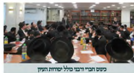
כינוס חברי ורבינו מלל יסודות העיון

בתוקף ובנחרצות לצד אותן ידיעות, כי הם עדיין