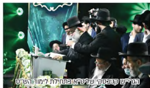
הגר"ש קניבסקי שליט"א בפתח לית לימוד הש"ס