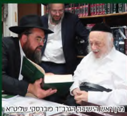
מרן ראש הישיבה הגר"ד פוברסקי שליט"א

קודם המעמד ההיסטורי שנערך בראשות גדולי התורה החסידות שליט"א עלו משלחת מראשי מפעל 'דף היומי' משניות' למעונם של מרן זקני הדור עיני העדה שליט"א לקבל את ברכותיהם לכינוס המרום גדולי ישראל שליט"א ברכו את כלל הלומדים והמצטרפים ללימוד 'דף היומי' משניות' ושבו את היוזמה בחום.