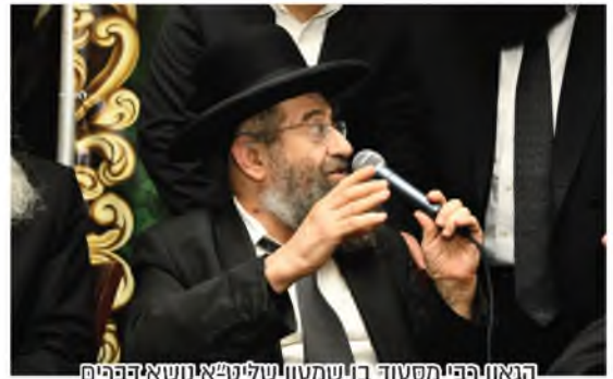
הגאון רבי מסעוד בן שמעון שליט"א נושא דברים