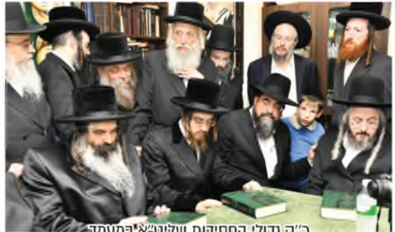
כ"ק גדולי החסידות שליט"א במעמד