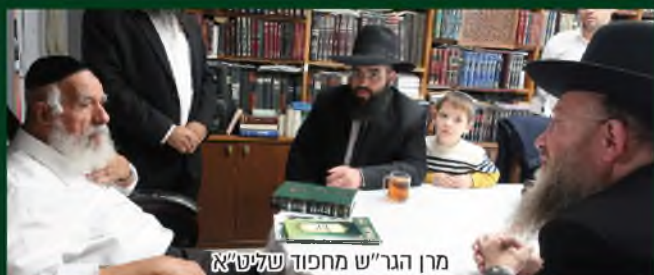
מרן הגר"ש מחפוד שליט"א