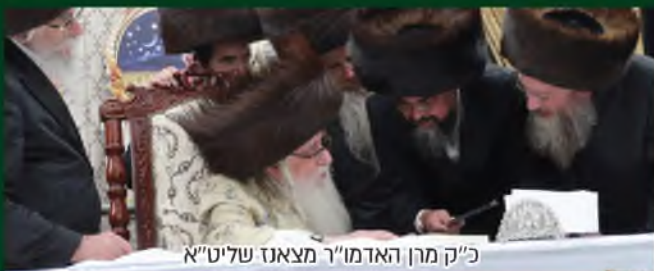
כ"ק מרן האדמו"ר מצאנז שליט"א