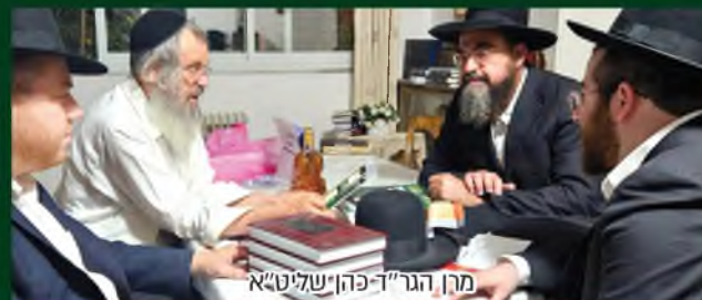
מרן הגר"ד פהן שליט"א