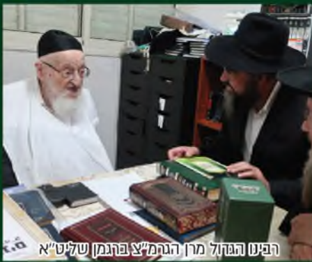
הפנימ הפדול מרן הגרמ"צ פרגמן שליט"א