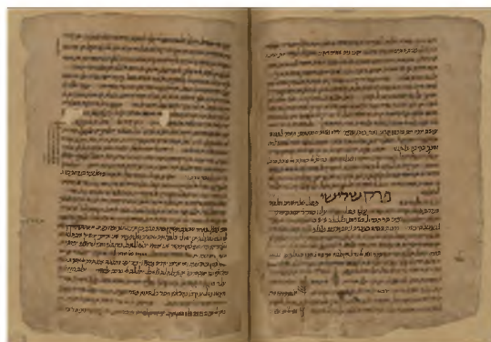
כתב יד של הרמב"ם בפירושו למשנה

4. כתבו הפוסקים כי במקום שיש סתירה בין פירושו של הרמב"ם למשנה לבין דבריו ב'יד החזקה' - יש לפסוק כפי שכתב ב'יד, משום שהרמב"ם חזר בו מחיבור זה שכתבו בצעירותו ממש (ב"י או"ח סי' ש"ח ד"ה וכבר כתבתי, וי"ד סי' רצ"ד ד"ה ומ"ש שנוהגת, ועל שו"ת רמ"ע מפאנו ס"ס ק"ז, וראה עוד בספרי כללי הפוסקים בזה), וכבר הרמב"ם עצמו