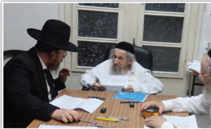
ונעשה תלמיד חכם ממש.

לפעמים אין לאדם כשרונות מבריקים, אבל יש לו כשרונות והבנה רדומים שמתפתחים עם הזמן, אין לו את הכשרון לתפוס במהירות, אבל הוא יודע לעבוד ולחקור, למרות שהתפיסה שלו לא מיוחדת, אם הוא לומד ברצינות, מתעקש לדעת מה כתוב, לחקור ולהבין. הוא מתפתח עם הזמן